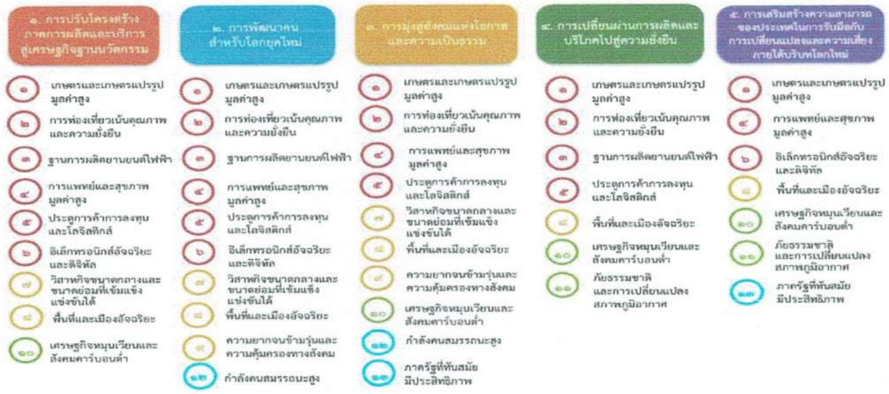
แผนภาพที่ ๓.๑ ความเชื่อมโยงระหว่างหมุดหมายการพัฒนา กับเป้าหมายหลัก